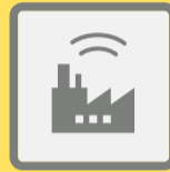
ГУДКИ ПРЕДПРИЯТИЙ И ТРАНСПОРТНЫХ СРЕДСТВ