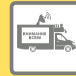
ПОДВИЖНЫЕ ЗВУКОУСИЛИТЕЛЬНЫЕ УСТАНОВКИ